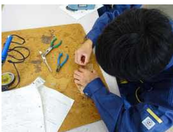
ものづくり制作① (入力回路づくり)