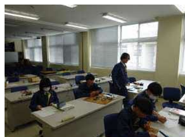
ものづくり制作② (入力回路づくり)