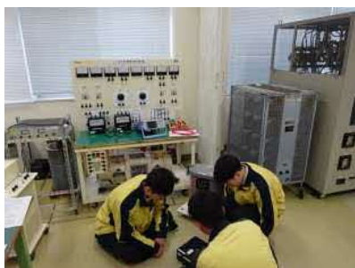
単相変圧器特性実験①

本校のホームページをご覧くださいありがとうございます。 今回の投稿は3年生の実習の様子です。