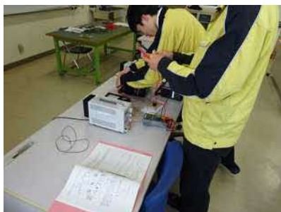
トランジスタ静特性 実験①