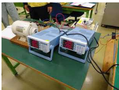
三相誘導電動機の 始動特性実験①