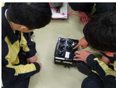
単相変圧器特性実験②