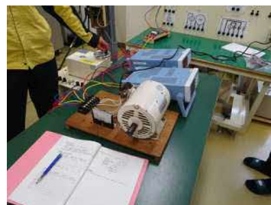
三相誘導電動機の 始動特性実験②