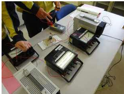
トランジスタ静特性 実験②