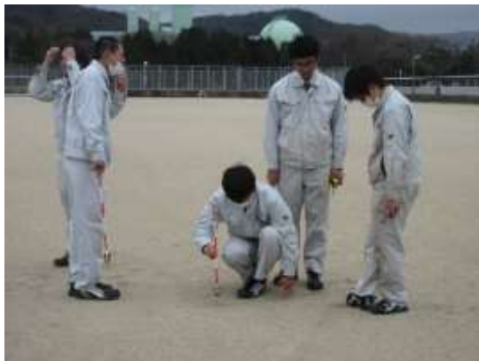
さらにプリズムを使って詳細な距離をだす。