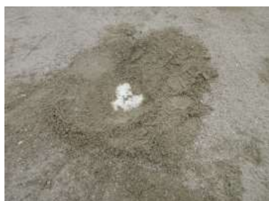
既存のプレートも土中から見つかった。