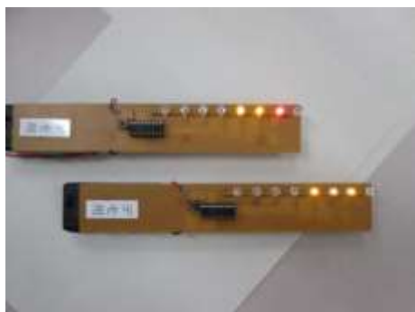
バーサイライタ（表面）

電子科ではバーサイライタの作成を体験してもらいます。バーサイライタとは一列に並べた高速に点滅するLEDを一定方向に振ると、目の残像によって空間に文字や絵を浮かびあげることができるものです。