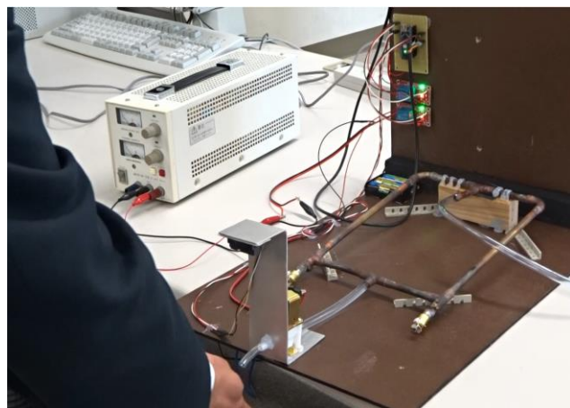
温水が流れる様子