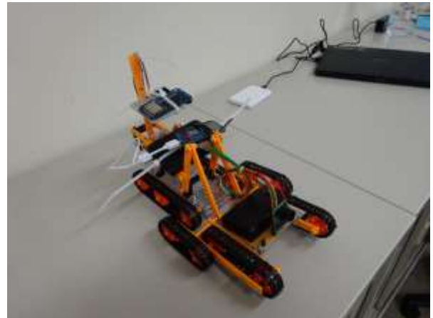
今回製作したIoT技術を用いたラジコン