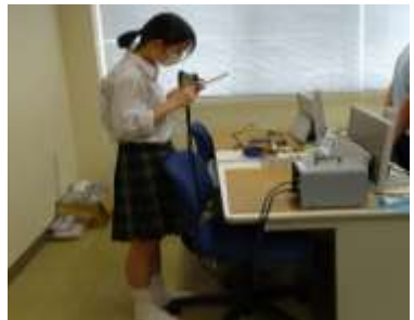
失敗しても先輩がすぐに直します