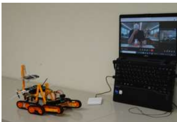
遠く離れた所から遠隔操作しています