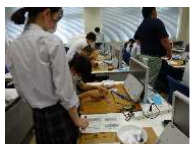
完成までまだまだかかります