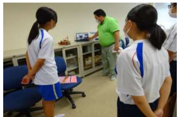
動かしている所を見ている