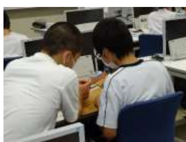
上手に製作ができてます