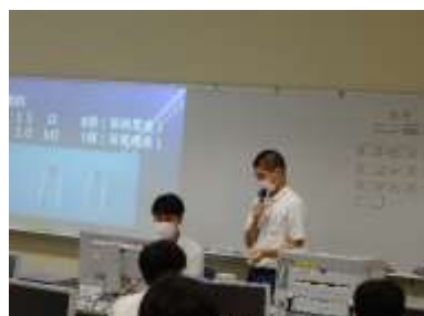
生徒が説明します