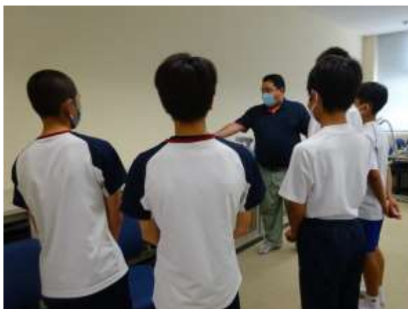
中学生の皆さんも興味をもって聴いています