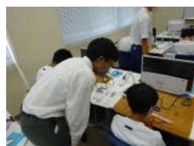
真剣に組み立てています