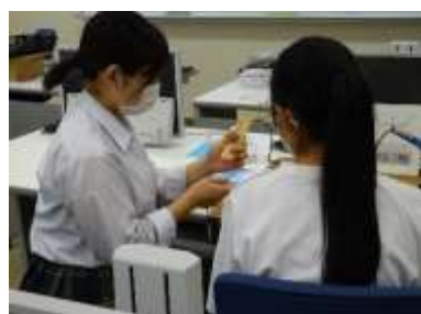
細かい所も丁寧に説明します