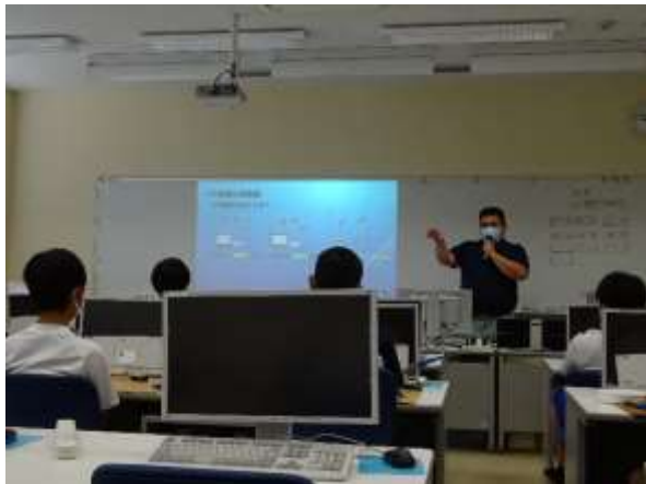
IoTの説明を教員がします