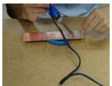
手元はこんな感じ