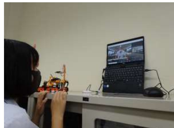
リモートでお互いの様子を確認しています