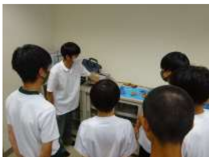
先輩の説明を聞いてます