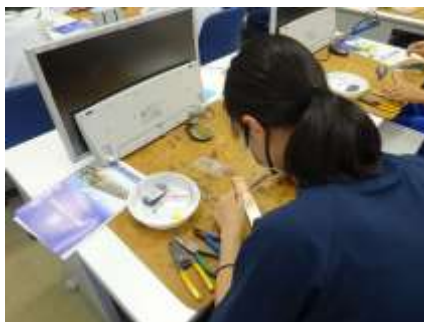
上手にできるかな？