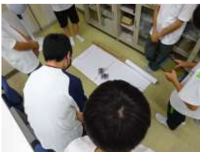
即席ロボット大会開催！