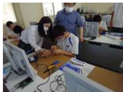
分からないことは先輩に聞こう