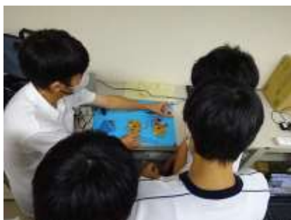
高校ではこんなモノを作ります。