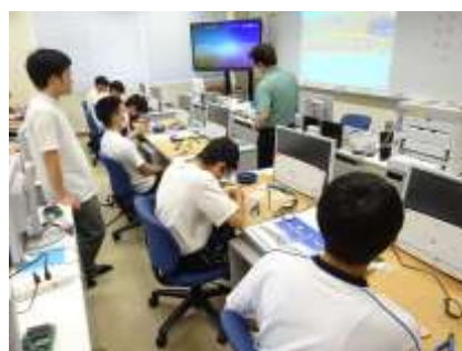
だいぶ出来てきたぞ！