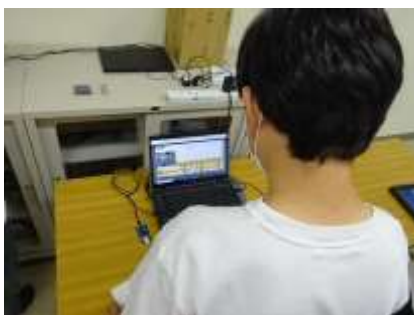
顔を認識しているぞ