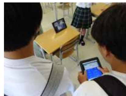
操作性も悪くないぞ！