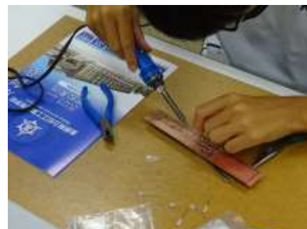
半田ごてで上手く使える？