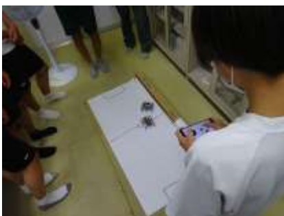
先にゴールさせるぞ！