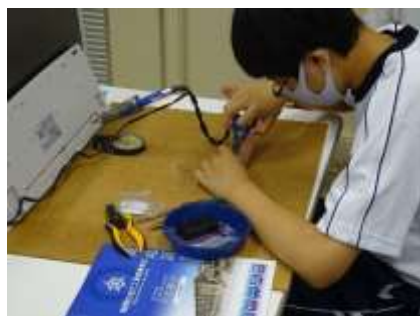
まだまだかかるな～