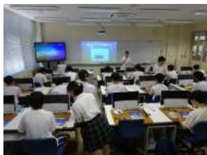
体験が始まりました。