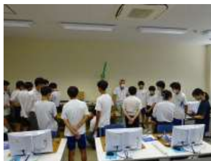
工業っておもしろいな