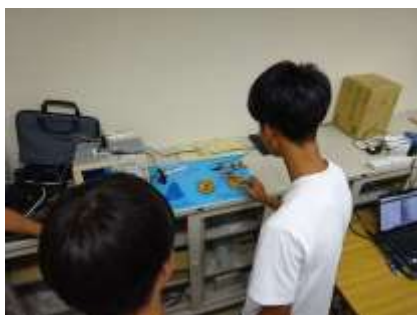
実際に触って体験してます