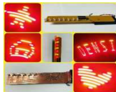
完成するとこんな絵が見えます