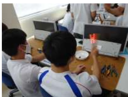
できた！何が見えるかな？