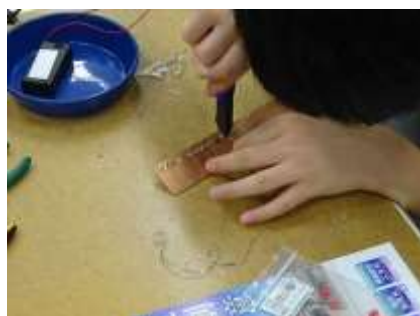
綺麗に切りましょう