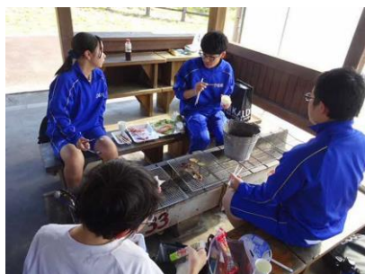
思い思いに楽しんでいます