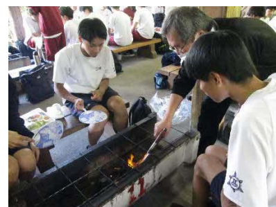
ガスバーナーで一発だ！