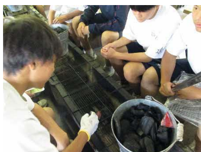
火起こしからやります