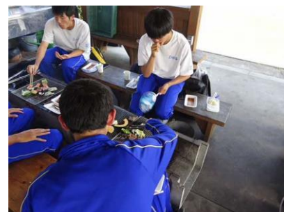
いっぱい食べて満腹だ～