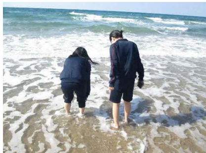
海にも少し入れました