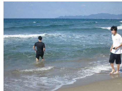
遠足たのしめました！

電子科では例年クラス全員でバーベキューをしています。ここ最近は感染症予防の観点から実施できていませんでしたが、今年は数年ぶりに行くことができました。生徒も普段の学校生活から離れて楽しんでいる様子でした。