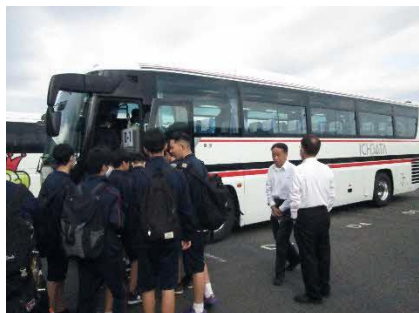
バスで向かいます

本校のホームページをご覧くださいありがとうございます。松江工業高校では10月25日に遠足が行われました。電子科は出雲市にあるキララコテージに行き、バーベキューをしました。今回は様子を投稿します。