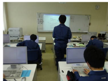
プログラミング 実習③