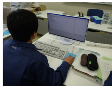
プログラミング 実習②