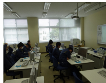
プログラミング 実習①